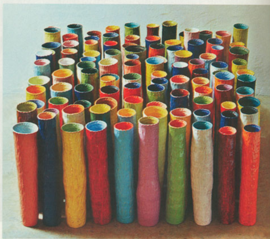
À gauche : Carta urgente a Buenos Aires , 2000. Terre rouge peinte aux émaux H. 150 x 120 x 50 cm. Médaille d'argent au 52 e Concours international de Faenza. À droite : Installation de 101 tubes modelés, 2001. Terre rouge peinte aux émaux, H. 60 x 200 x 200 cm

donne son sens. L'objet tout seul n'est rien. Mis en cause comme signe d'une tradition, il est réintégré au sein d'un ensemble plus vaste (l'installation) qui lui donne sa synergie et permet entre autre à la couleur d'agir. Elle y fait usage de la répétition et de la variation modulaire qui appartiennent également à la musique. Elle s'inscrit ainsi dans un « métissage » des genres très contemporain. Elle ouvre virtuellement l'espace de l'art céramique à l'infini. Elle a fait du cercle la figure principale de ses compositions. De Mondrian à l'Art concret, les mouvements occidentaux de l'abstraction géométrique considèrent l'horizontale et la verticale comme les deux directions fondamentales de la compréhension du monde. L'Extrême-Orient l'a plutôt refermé sur le cercle. Avec ses contenants sans fond, ses cylindres, ses tronçons de tube, Zotta réunit les principes en faisant de la figure circulaire un principe générateur d'infini. Intuition assez géniale quand on pense à la place de la forme « nanotubulaire » dans la recherche scientifique contemporaine! On n'oublie pas non plus que le plaisir mental et sensoriel que procure la céramique de Silvia Zotta a sans doute un rapport avec son origine sud-américaine. Comme le disait Aurélie Nemours, la grande artiste constructiviste de la couleur qui vient de s'éteindre: « Il faut qu'un tableau flambe et c'est tout! »